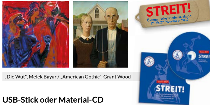
„Die Wut“, Melek Bayar / „American Gothic“, Grant Wood